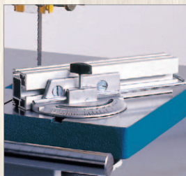
PPS 740, 840