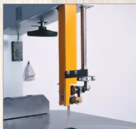
PPS 740, 840